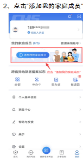
2、点击“添加我的家庭成员”