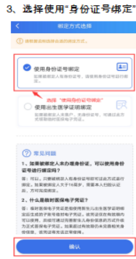
3、选择使用“身份证号绑定”